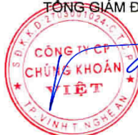
Đặng Thái Nguyên